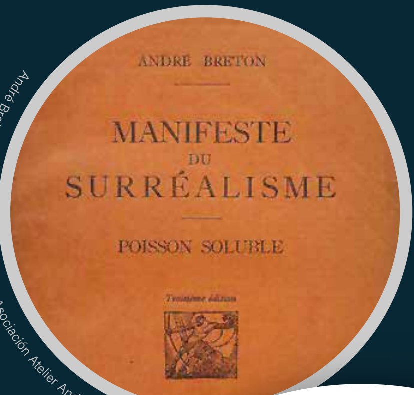
André Breton, Manifiesto surrealista, 1924. Asociación Atelier André Breton.