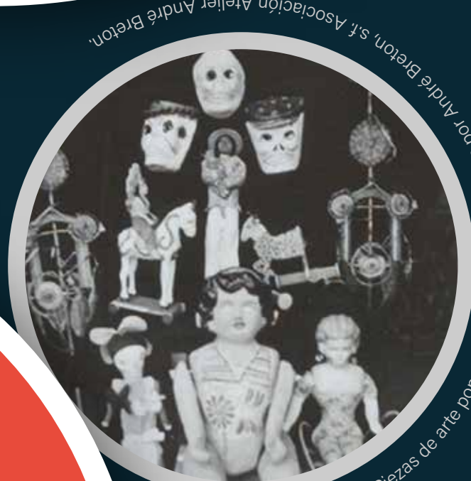
Autor no identificado. Piezas de arte popular mexicano, colección de la Asociación Atelier André Breton.

Con esta obra Breton definió una postura de inconformidad sobre las convenciones sociales con el fin de liberar el pensamiento y la imaginación de las limitaciones también impuestas por la moral, así se podría acceder a una realidad más profunda, y más auténtica, subvirtiendo las formas artísticas tradicionales, así como las normas estéticas.