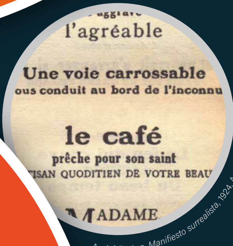
André Breton, Manifiesto surrealista 1924. Asociación Atelier André Breton.

Para él, las obras surrealistas eran aquellas que contenían una arbitrariedad sobre la relación de los elementos presentados, y que requerían mayor tiempo para traducir la imagen a un lenguaje práctico, sin importar que lo que se presenta entre un orden alucinatorio, concreto o abstracto, niegue una propiedad física elemental, o desencadene la risa. Las imágenes surrealistas, para él, se presentan de un modo espontáneo y despótico.